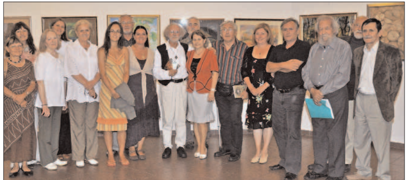
A Nagybányai-Kecskeméti Festőiskola táborzáró kiállítás, 2011. június 28. A kiállítás megtekinthető 2011. augusztus 10-ig a Kölcsey-házban.