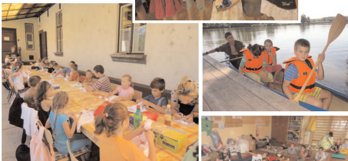
A MUNKÁKRÓL ÉS A PIHENÉSRŐL...