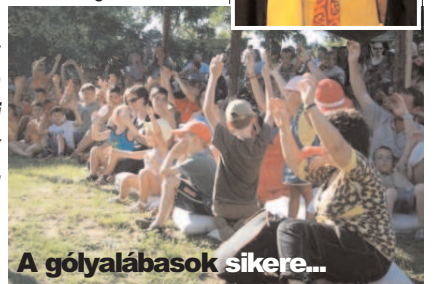
A gólyalábasok sikere...