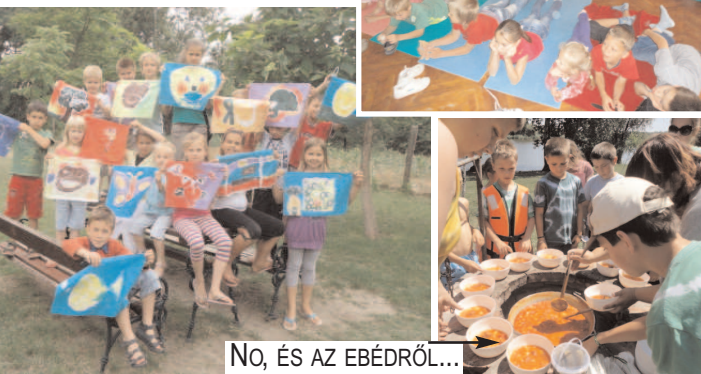
NO, ÉS AZ EBÉDRŐL...