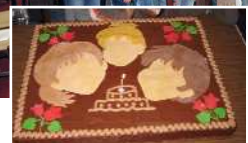
Csoportkép és a szép, finom torta...